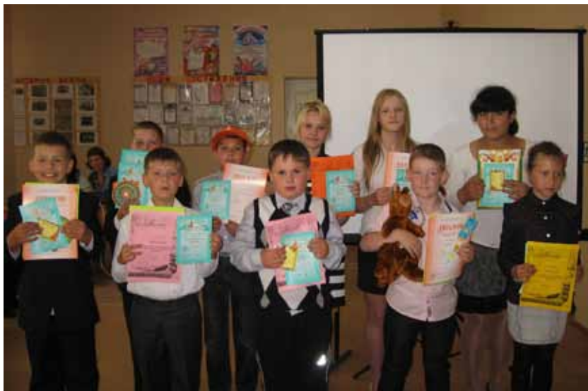
Победители и участники международных конкурсов Русский медвежонок и Кенгуру