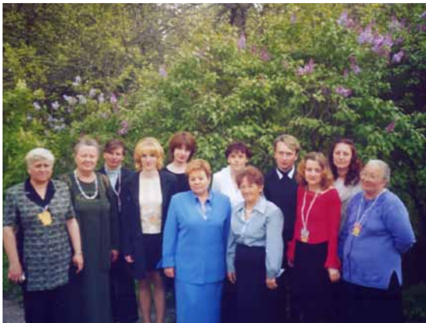
Учителя Мушковичской школы