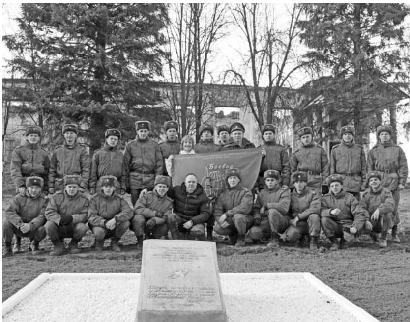
Курсанты Военной академии г. Смоленска после воскресника у могилы Неизвестного солдата. Апрель 2015 г.

Слушая рассказы о Великой Отечественной войне, мы, современное поколение, лучше понимаем наших прадедов, многие из которых отдали жизни, чтобы мы имели возможность жить сегодня в свободной стране. Записи, сделанные на бумаге и отпечатанные в типографии, долговечнее человеческой жизни. О Великой Отечественной войне написано много мемуаров генералами и маршалами. Кто-то может сказать, что они интереснее и имеют большую ценность для потомков. Я с этим не согласна. Ведь рядовые солдаты и сержанты вынесли на своих плечах основные тяготы войны. Каждый солдат внес свою крупицу в общую Победу. Поэтому каждый из тех, кто остался жив, имеет право, чтобы были записаны и напечатаны и его воспоминания.