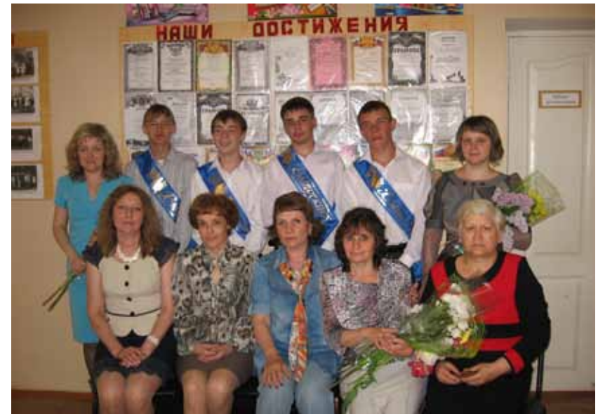
Выпускники 2013 года