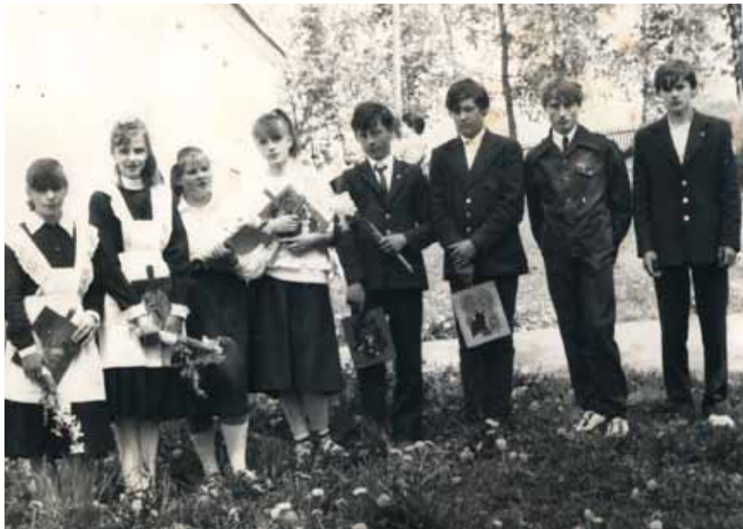
Выпускники 1988 года