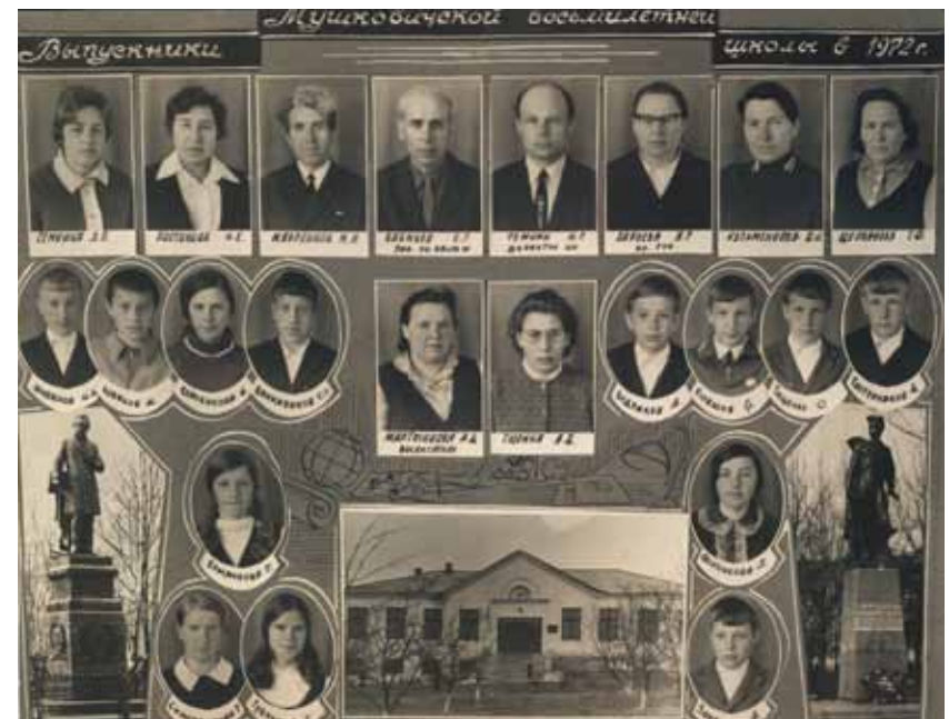
Выпуск 1972 года.tif