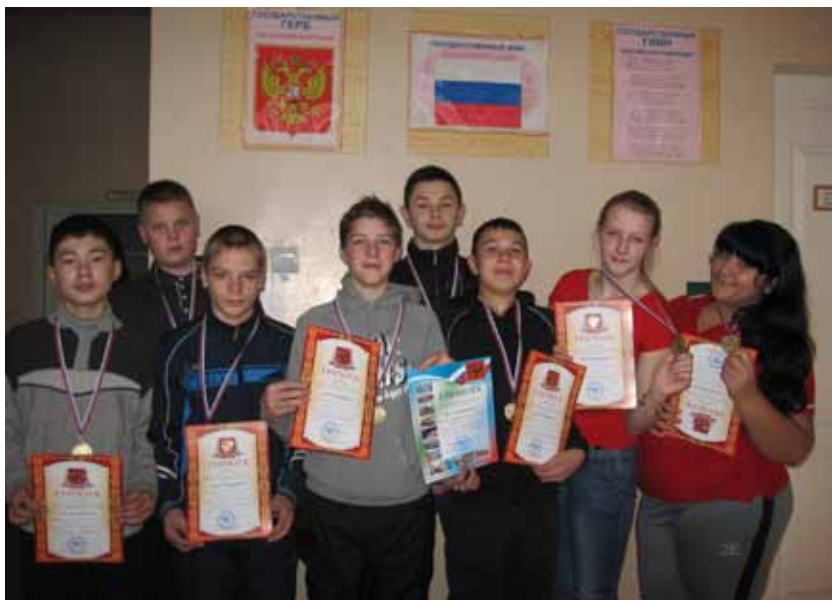
Победители районных спортивных соревнований