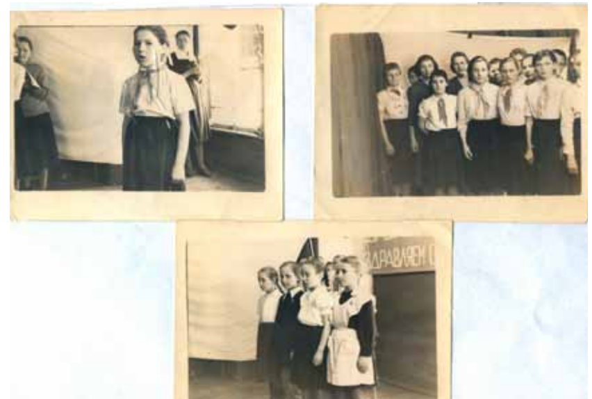
Конкурс на лучшего чтеца