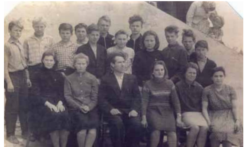
Выпускной класс 1963 года