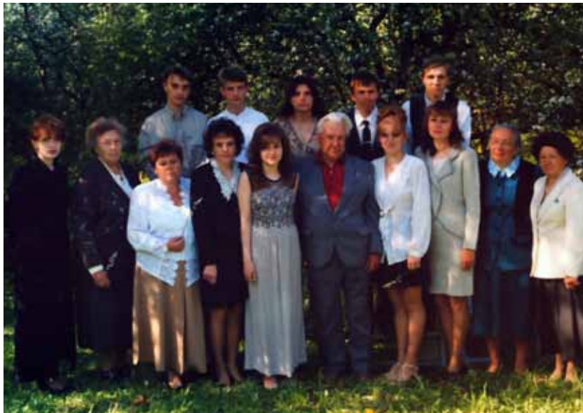
Педагогический коллектив. 1999 год