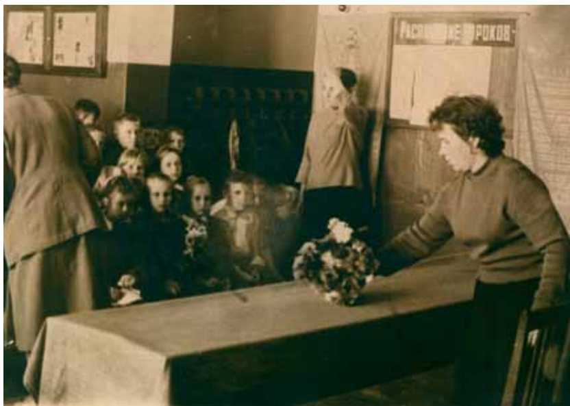
Подготовка к встрече с писателем Борисом Васильевым