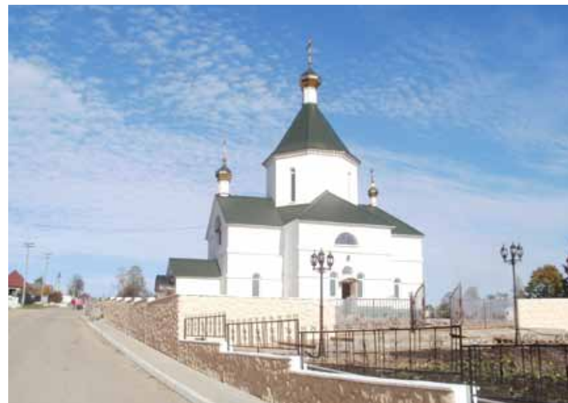
Храм в честь Святой Живоначальной Троицы