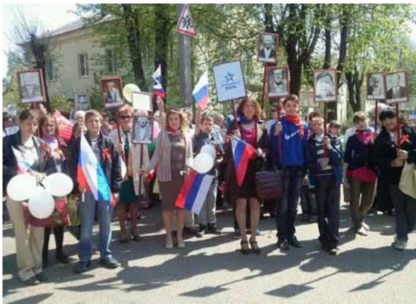
Мушковичская школа в акции Бессмертный полк. Май 2014 года